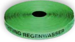
»ACHTUNG REGENWASSER« Art. Nr. 23044