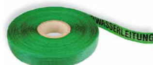
»ACHTUNG ABWASSERLEITUNG« Art. Nr. 23021