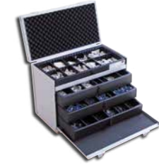
Aluminium 525x275x410 mm*