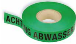
»ACHTUNG ABWASSERDRUCKLEITUNG« Art. Nr. 23032