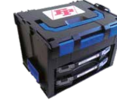
Kunststoff 442x357x321 mm*