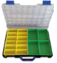
Kunststoff 440x350x80 mm*