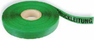
»ACHTUNG ABWASSERDRUCKLEITUNG« Art. Nr. 23024