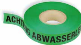
»ACHTUNG ABWASSERLEITUNG« Art. Nr. 23028