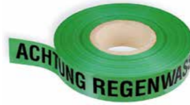
»ACHTUNG REGENWASSERLEITUNG« Art. Nr. 23042